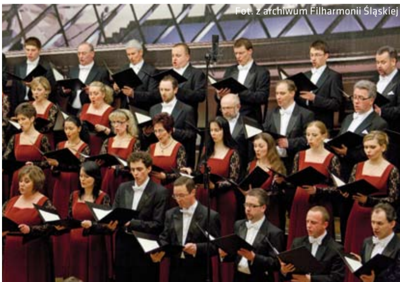
Chór Filharmonii Śląskiej