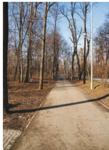
Fragment ścieżki pieszo-rowerowej przy Al. Łyska, luty 2011 r.