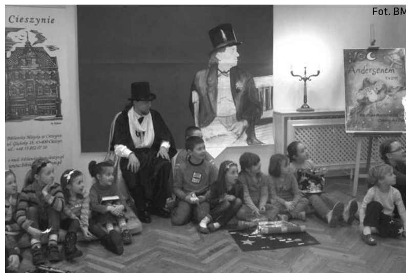
Baśniopisarz Andersen zabawiał dzieci przez całą wieczór

„Noc z Andersenem” to przedsięwzięcie zawsze przygotowywane z myślą o dzieciach i z zamiarem sprawienia im jak