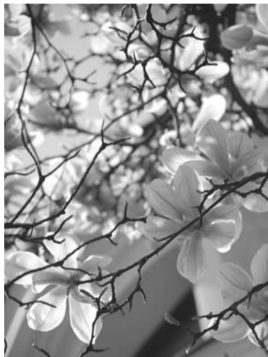
Magnolie, fot. R. Karpińska