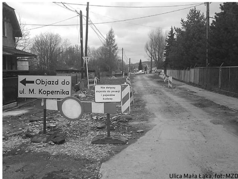
Ulica Mała Łąka