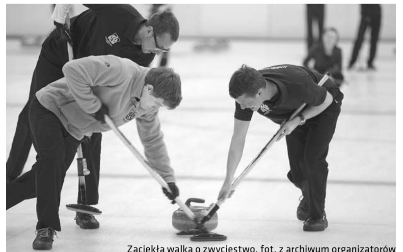
Zaciekła walka o zwycięstwo