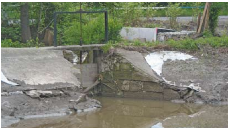
Fragment zalewu kajakowego przed modernizacją, maj 2010 r.