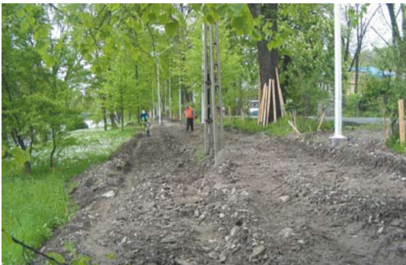
Rozpoczęcie prac przy ścieżce pieszo-rowerowej przy Al. Łyska, maj 2010 r.