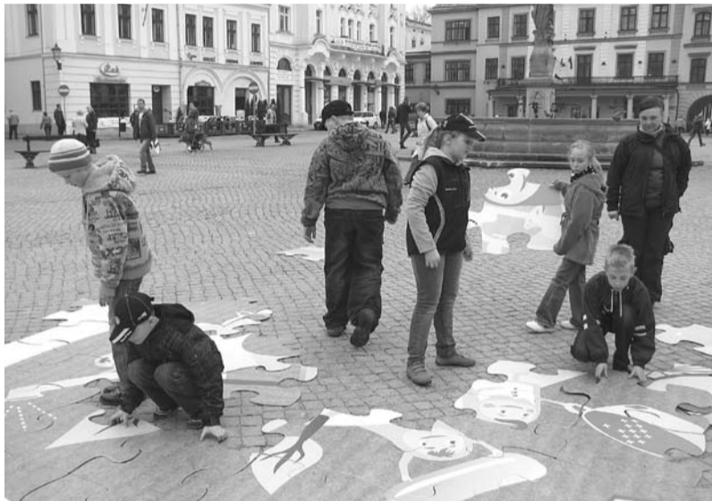
Układanie gigantycznych puzzli na cieszyńskim Rynku

Głównym i niewątpliwie najbardziej spektakularnym punktem programu był Zielony Kontener zasilany energią słoneczną. W potężnym pojemniku, któ-