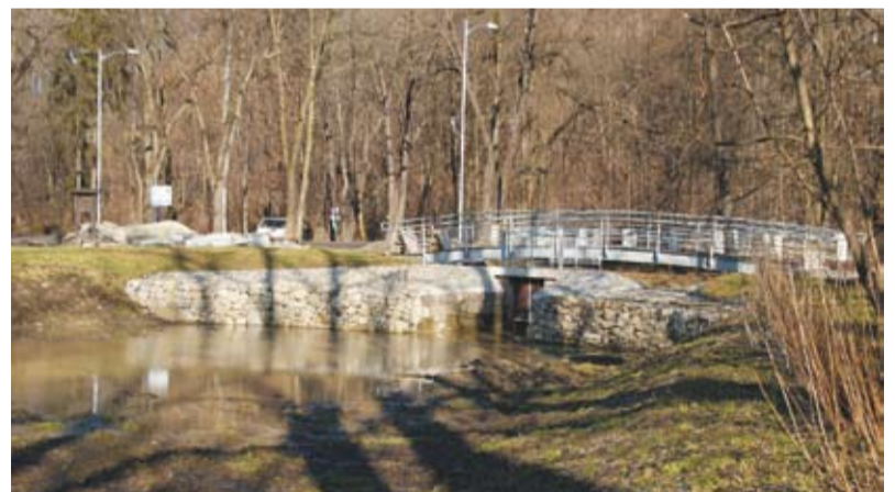
Fragment zalewu kajakowego po modernizacji, luty 2011 r.