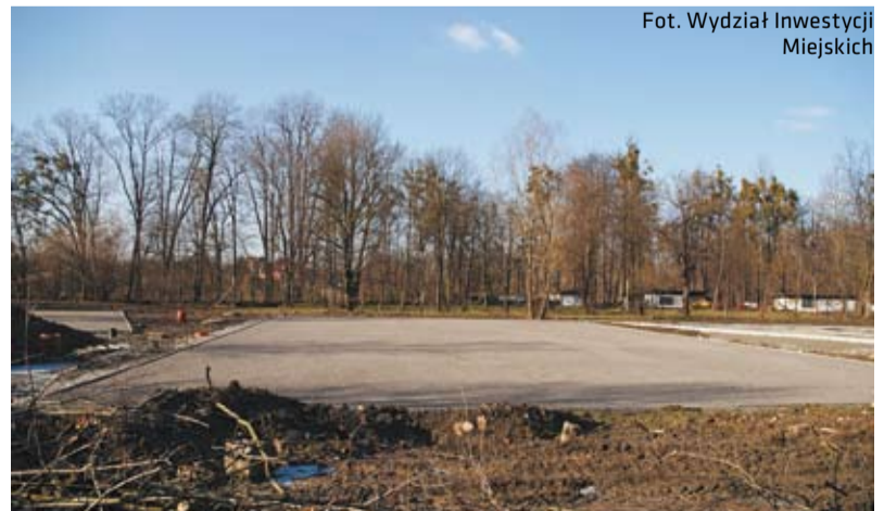
Zagospodarowanie terenu przed stadionem pod Wałką - parking, luty 2011 r.