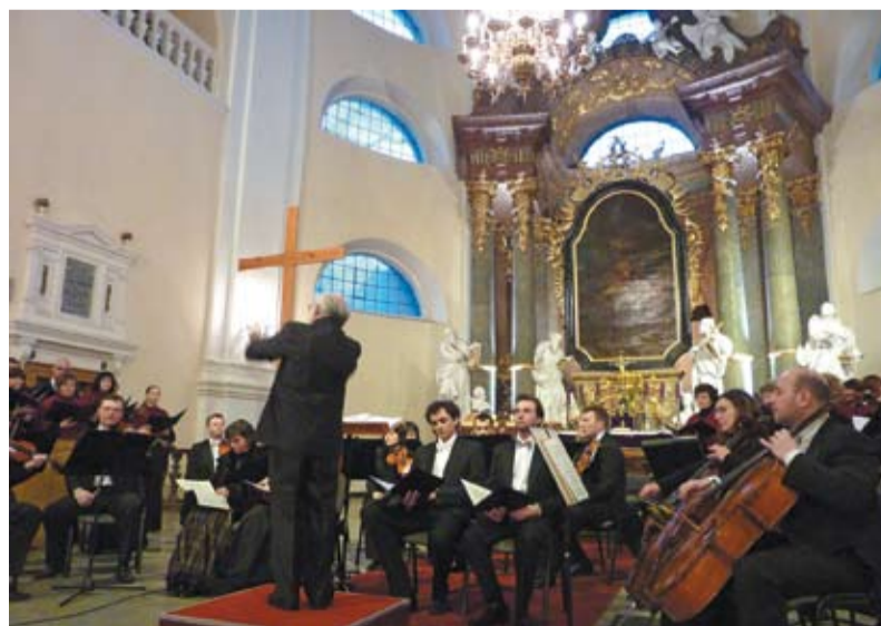
Ubiegłoroczny koncert