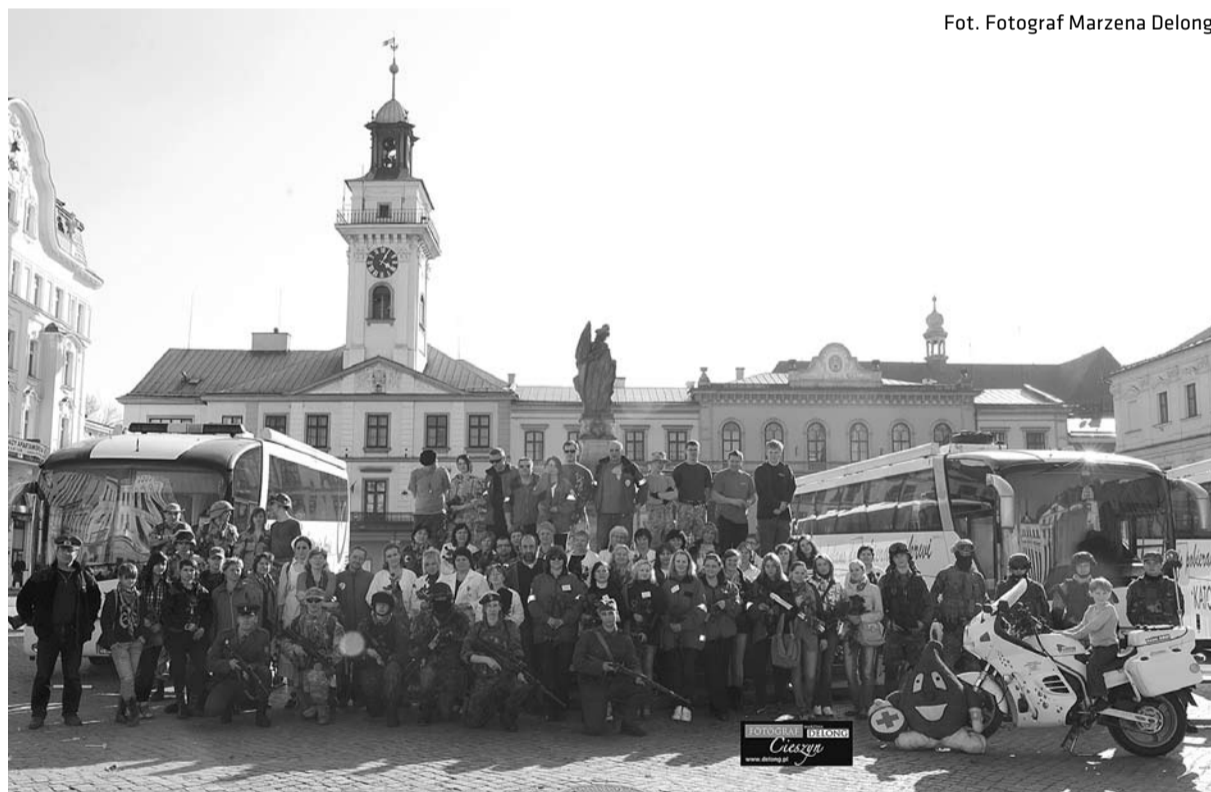
Zaangażowani w organizację akcji oddawania krwi

W dniu 31 marca Komisja Ochrony Przyrody PTTK „Beskid Śląski” w Cieszynie, była organizatorem kolejnego „Wiosennego Sprzątania Rezerwatów Przyrody”. Udział wzięły zarówno cieszyńskie gimnazja, jak i szkoły średnie.