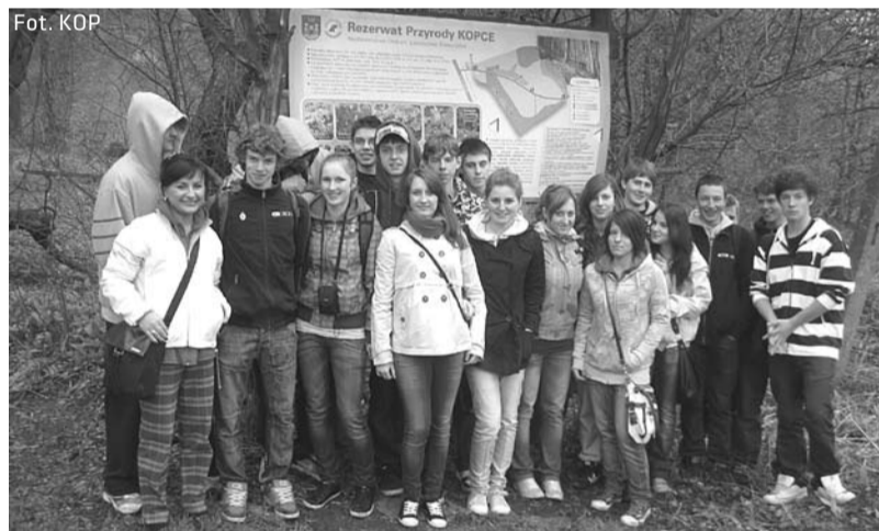
Uczestnicy wycieczki do rezerwatu Kopce