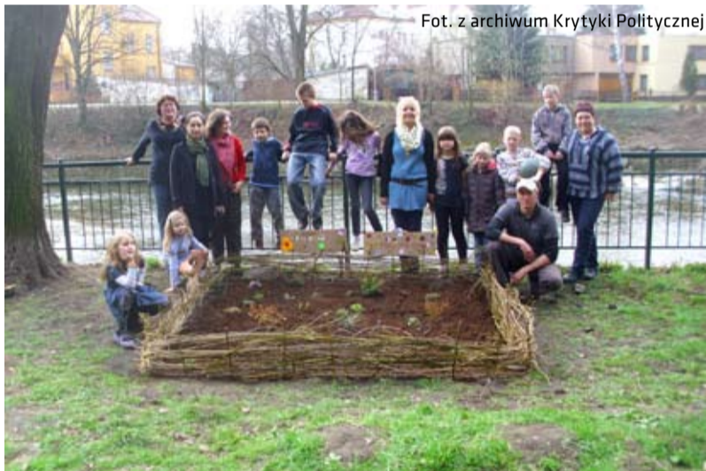
Efekt pracy „ogródkowej grupy”

Świetlica Krytyki Politycznej „Na Granicy”