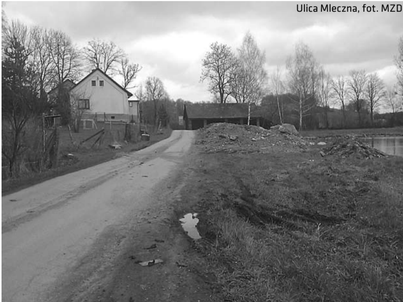
Ulica Mleczna

Miejski Zarząd Dróg informuje, że w miesiącu marcu przystąpił do realizacji przedsięwzięcia inwestycyjnego Gminy Cieszyn pn.: „Rozbudowa ulicy Mlecznej oraz remont nawierzchni”.