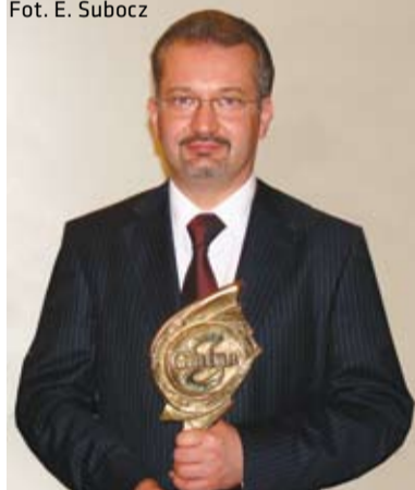
Burmistrz Miasta z odebraną statuetką