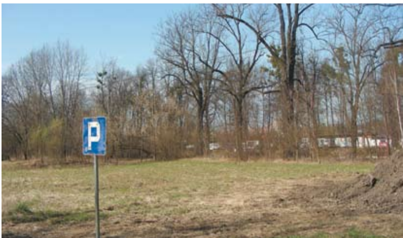
Zagospodarowanie terenu przed stadionem pod Wałką - teren przyszłego parkingu, maj 2010 r.