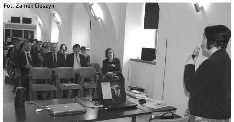
Konferencja odbyła się na Zamku Cieszyn